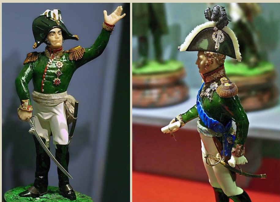
Коллекция «Герои войны 1812 г.». 2012 г.

После кризиса 2008 г. многие камнерезные мастерские России резко снизили объемы производства и вынуждены были временно сократить число работников. Однако никто не отменял знаменательных дат и дней рождения. Ведь, не секрет, что многие камнерезные «человеческие фигурки» предназначены для подарков и пополнения коллекций. В 2012 г. Россия отмечала «день Бородина», 20-летием начала Отечественной войны 1812 г.