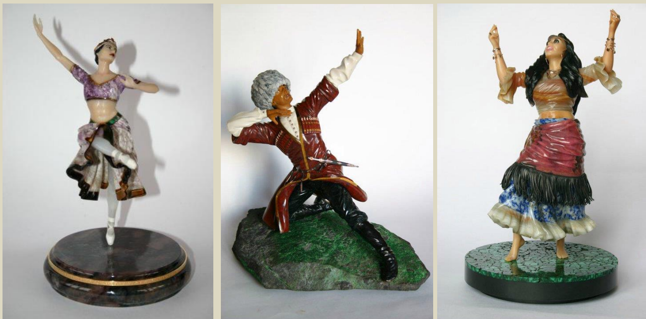
Коллекция «Танцы народов мира». 2006 год.

Особенность произведений студии, принципиальная, как пояснил Антонов – все фигурки исполняются в динамике, экспрессивны. Это кредо мастера. Фигурки Фаберже, художник называет «столбиками», за их неподвижность. Но эта экспрессия требует закрепления фигурок на подставках, внутри опорной ноги находится стержень. Подставкам придаётся декоративный вид и она «работает» в единой композиции. Некоторые фигурки, как и у Фаберже «сидят» на стульях и креслах и скамейках. Само кресло под священником размещено на подставке из уваровита. Тора у «Хасида» передана «еврейским камнем». Художественными средствами передана иллюзия написанного текста. Кинжал ювелирной работы у «Осетина» вынимается, в танце зажат между зубов.